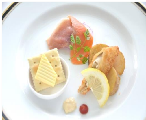
(ライトプラン一例)