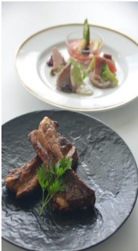
(レギュラープラン一例)